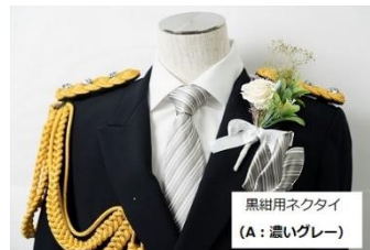
Aタイプ（濃いシルバー）