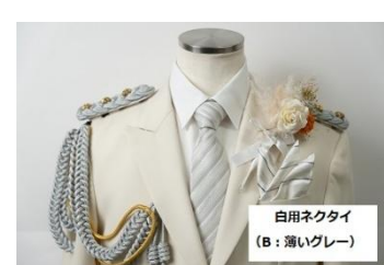
Bタイプ（薄いシルバー）