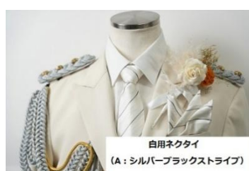
Aタイプ（シルバーブラック）