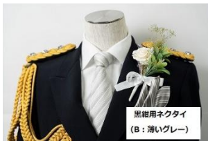
Bタイプ（薄いシルバー）